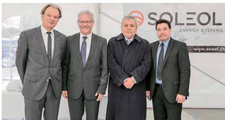
Ceremonia de colocación de la primera piedra en Estavayer-le-Lac, cantón de Friburgo.

“En Migros apreciamos el impresionante mar de paneles que descansan sobre el techo y que por más de 30 años garantizarán la iluminación y el fluido eléctrico en este concurrido local.”