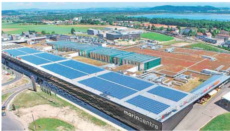
Migros: Instalación de 1MW – 4000 paneles – 6'500m 2 .

Jean-Louis Guillet informó que SOLEOL S.A., cuyo lema